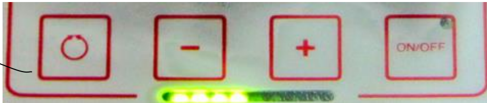
Figure 4 : panneau de contrôle