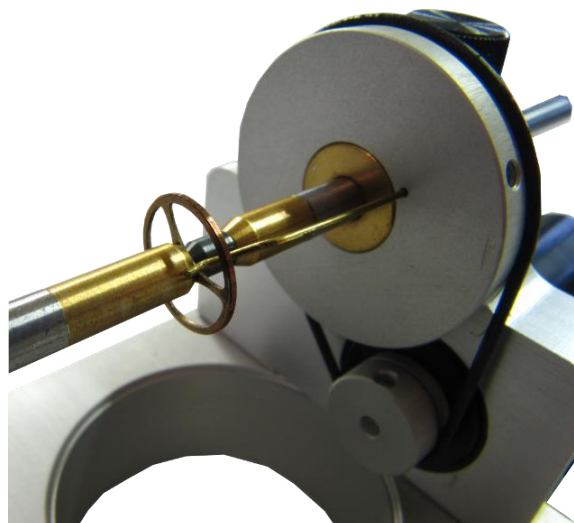
Figure 2 : positionnement correct du mobile